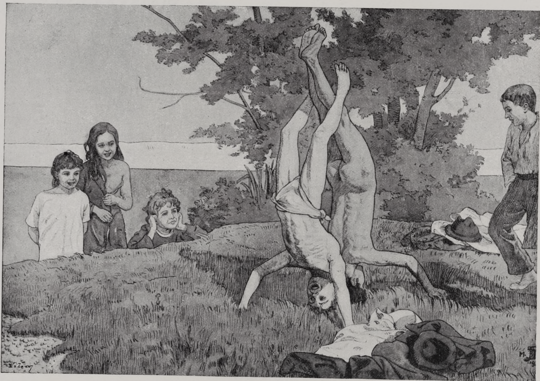
F. B. DOUBEK.

Z prvních dnů na studiích mám malou hrstku ostrých zlomkovitých dojmů. V městě mi koupili